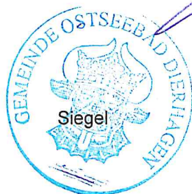
..... Guido Keil 1.stellvertretende Bürgermeister