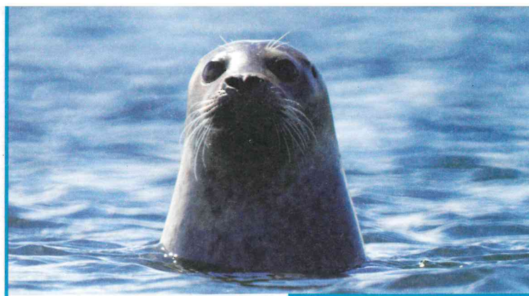
Rundlicher Kopf und v-förmig angeordnete Nasenlöcher lassen es erkennen: Hier schwimmt ein Seehund im Wasser

So niedlich Robben erscheinen, Vorsicht ist geboten: Sie sind Raubtiere. Kegelrobben mit bis zu 300 Kilogramm sogar die größten heimischen Raubtiere. Das bescheinigt ihr typisches Raubtiergebiss. Mit ihren hochsensiblen Tasthaaren an Schnauze und Augenbrauen jagen sie nach Fischen.